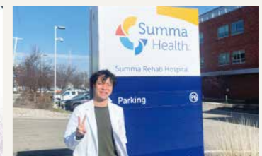
アメリカでの海外研修