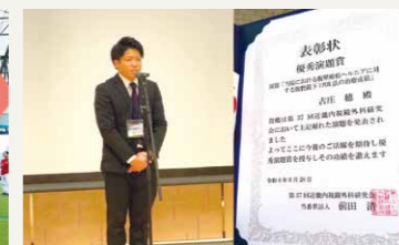
学会へ参加(優秀演題賞をいただきました)