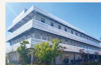
研修医スペースは新築の管理棟

2年目は、主に専攻を希望する診療科において、研修指導責任者の指導の下、高度な知識と技術を習得します。内科系、外科系いずれのコースを選択しても心筋梗塞をはじめとした心・循環器系、脳卒中をはじめとした中枢神経系の救急疾患、および骨折などの整形外科的救急傷病に対するプライマリ・ケアが習得できます。また、アメリカでの海外研修制度もあります。