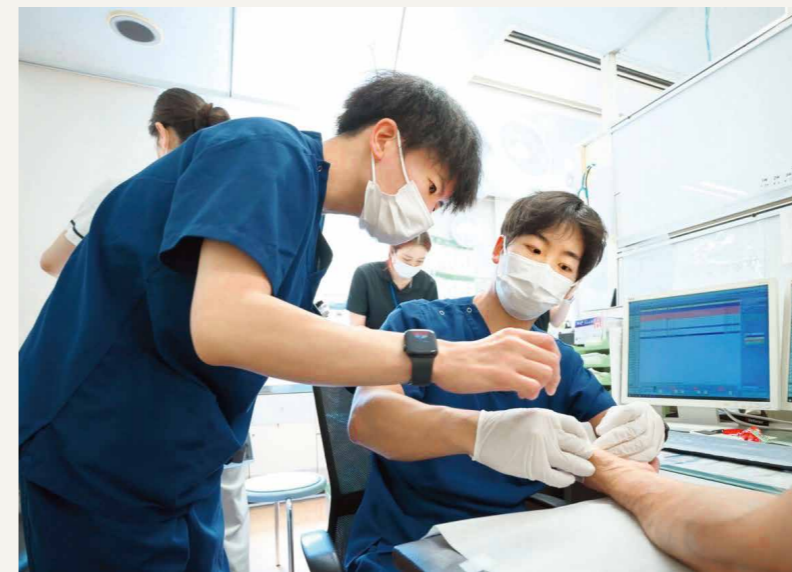
指導風景(右:研修医)

病床数：300床 外来患者数：1日当たり約342人 入院患者数：1日当たり約14人 給与(月収)：1年次36万円、2年次38万円