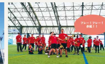
ペガサス大運動会